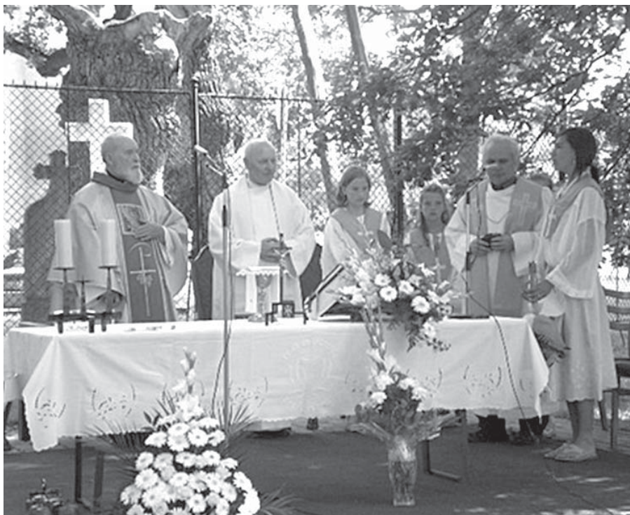
Aranymise Héderváron 2008-ban

letelte után újra Budapestre került, egy teljesen más, igazi elit környezetbe, a második kerületbe.